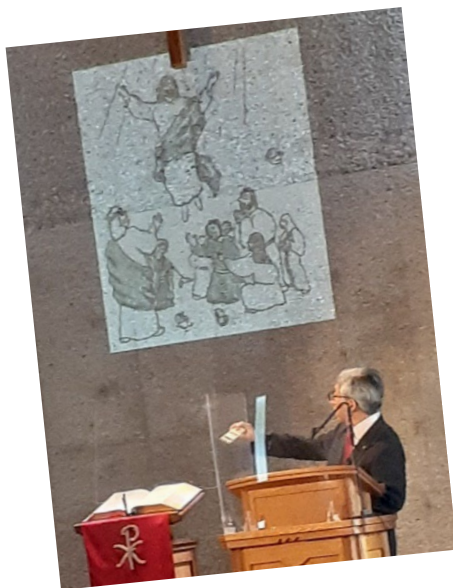
イエス様が天に昇られ、

6月5日はペンテコステ、12日は花の日でした。今回は、ペンテコステの合同礼拝の様子をお伝えしますね。